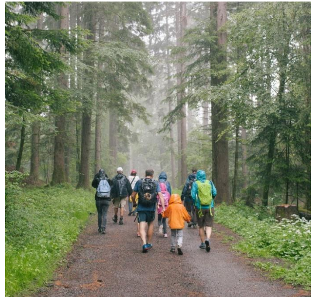
Parc Naturel du Jorat, Photo © Yann Laubscher